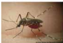
Aedes aegypti +++